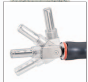
BIEGSAM: Das 2404 passt sich im Winkel maximal dem Terminal an.