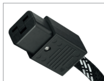
AC-2502 | C19