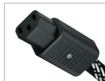
AC-2502 | C13