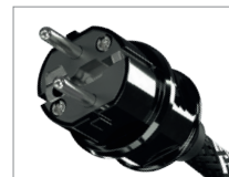
AC-2502 | SCHUKO